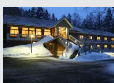
お泊りはゲレンデ近くの風白馬！