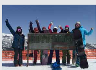
お一人様でのご参加大歓迎！

2日目には”キャンパー専用ゴンドラ”を特別運行し、ファーストラックライドも体験出来ます。