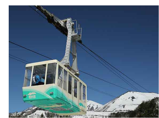
<ゴンドラからは北アルプスが一望>